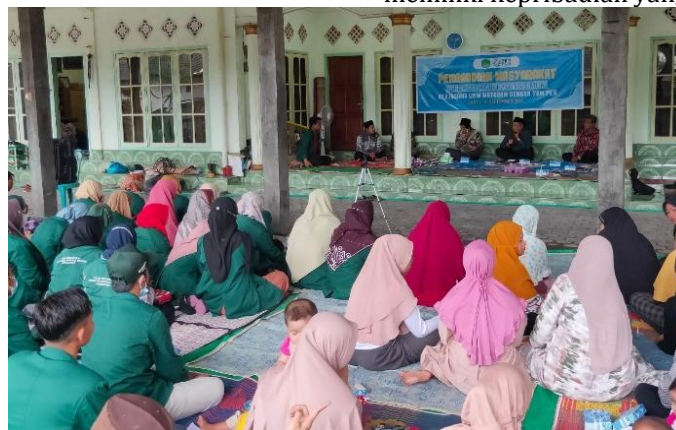
Gambar 2. Penyampaian Materi Sosialisasi

Para orang tua di desa ini masih banyak yang beranggapan peran penting seorang ayah hanya untuk mengurus hal yang berkaitan dengan finansial. Angapan-anggapan seperti itu yang perlu dibenahi dan diluruskan. Pentingnya pendidikan anak tidak hanya pola asuh ibu saja namun juga ayah. Menurut Ibu- ibu di sana, Bapak-bapak lebih berfokus bekerja dan mencari nafkah. Ibu-ibu lah yang berperan mengasuh anak, mengantarkan sekolah, mengurus pekerjaan rumah, dan mendidik anak. Peranan orang tua terhadap pendidikan anak tentu tidak dapat digantikan oleh siapa pun, karena orang tua tempat pertama bagi anak untuk memperoleh pendidikan. Oleh karena itu, adanya kegiatan sosialisasi ini (Gambar 2) mampu untuk memberikan pendidikan kepada seluruh orang tua untuk memberikan pendidikan yang terbaik bagi anaknya. Perkembangan teknologi yang begitu pesat menjadi tantangan tersendiri bagi orang tua untuk mendidik anaknya menjadi generasi yang tetap memiliki kepribadian yang baik.