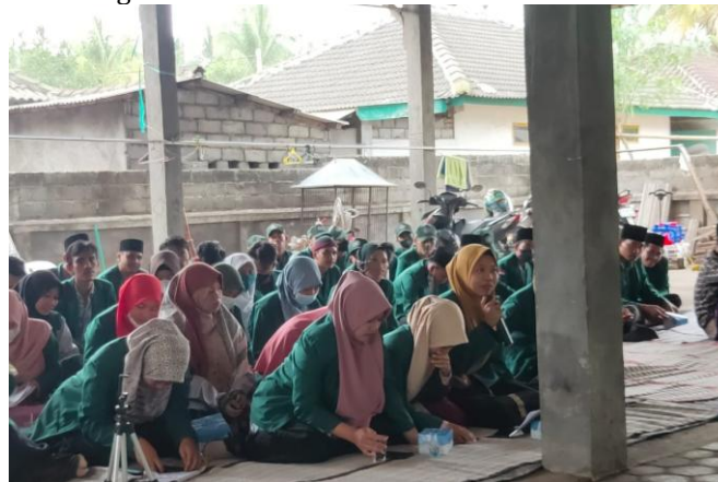
Gambar 3. Sesi FGD dan Tanya Jawab

Orang tua mendukung pertumbuhan intelektual anak, pendidikan merupakan proses seumur hidup yang meliputi lingkungan keluarga, sekolah, dan masyarakat. Pada masa usia 0-5 tahun merupakan masa dimana anak belajar lebih cepat dibandingkan dengan tahap usia selanjutnya. Sumbangan yang termasuk paling penting dari orang tua yakni terhadap perkembangan anak adalah menjamin dan menyakinkan bahwa anak akan mendapat kesempatan untuk memperoleh banyak pengalaman yang beragam. Orang tua perlu menyadari bahwa setiap individu mempunyai profil kemampuan dan kecerdasan yang berbeda-beda [7].