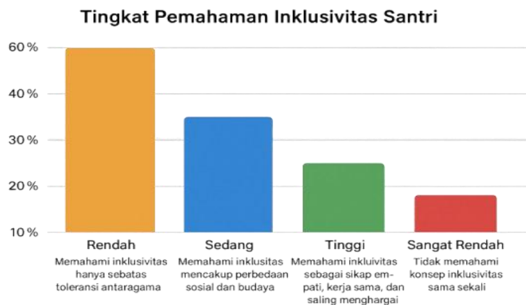
Gambar 1. Hasil Pretest kegiatan

Tahap selanjutnya adalah pelaksanaan pretest yang dilakukan melalui angket dan tanya jawab singkat sebagai bentuk refleksi awal. Hasil pretest menunjukkan bahwa tingkat pemahaman santri terhadap konsep inklusivitas masih tergolong rendah, yakni sekitar 65% (Gambar 1). Mayoritas santri belum mampu mengaitkan konsep inklusif dengan kehidupan sosial sehari-hari maupun dengan nilai-nilai Islam secara komprehensif. Temuan ini mengindikasikan bahwa pemahaman santri masih bersifat parsial dan normatif, sehingga diperlukan intervensi pembelajaran yang lebih kontekstual dan reflektif agar nilai-nilai inklusif dapat terinternalisasi dalam keseharian mereka di lingkungan pesantren.